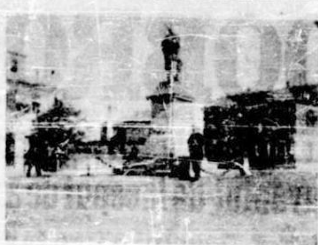
Piața Independenței cu Stăinul lui Ovidiu